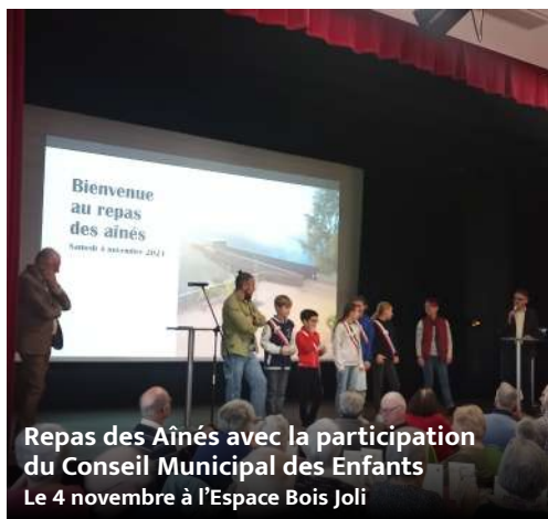
Repas des Aînés avec la participation du Conseil Municipal des Enfants Le 4 novembre à l'Espace Bois Joli