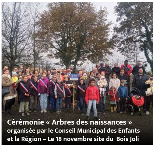
Cérémonie « Arbres des naissances » organisée par le Conseil Municipal des Enfants et la Région – Le 18 novembre site du Bois Joli