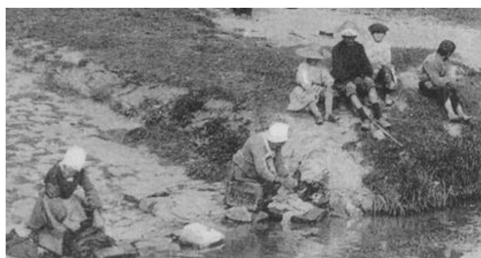
Le lavoir, côté Château-Thébaud, à proximité du débarcadère et de la buvette. (Détail d'une Carte postale)