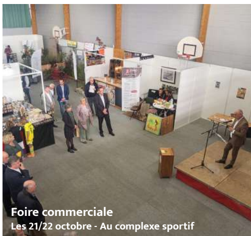
Foire commerciale Les 21/22 octobre - Au complexe sportif