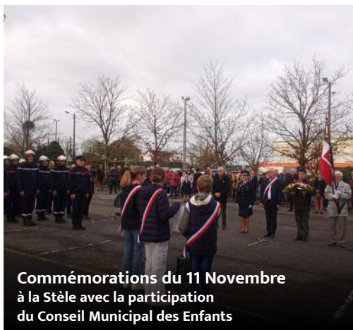
Commémorations du 11 Novembre à la Stèle avec la participation du Conseil Municipal des Enfants