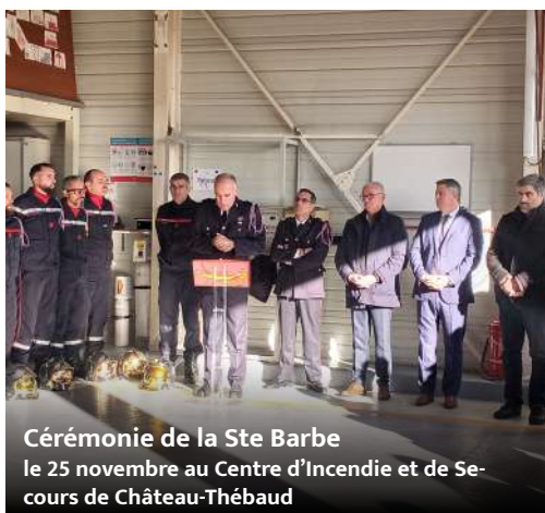
Cérémonie de la Ste Barbe le 25 novembre au Centre d'Incendie et de Secours de Château-Thébaud