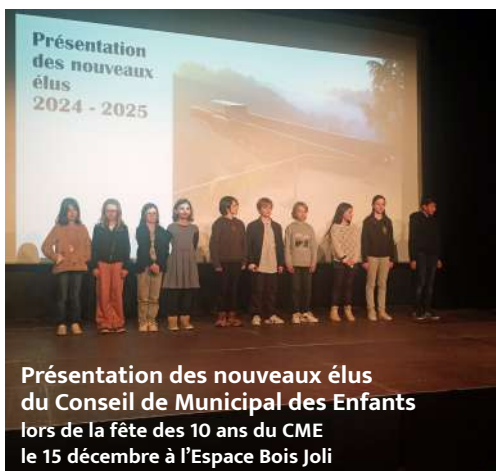
Présentation des nouveaux élus du Conseil Municipal des Enfants lors de la fête des 10 ans du CME le 15 décembre à l'Espace Bois Joli