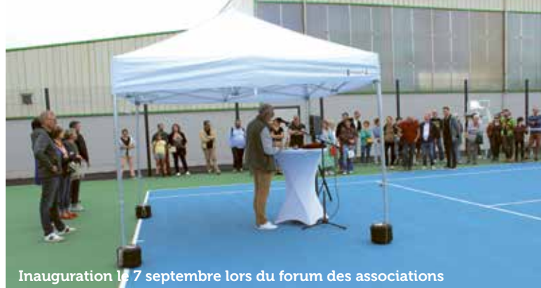
Inauguration le 7 septembre lors du forum des associations

Certains adhérents choisissent quant à eux de s'inscrire simplement en « loisir » pour bénéficier des créneaux hebdomadaires dédiés, dans une des 4 salles omnisports proposées.