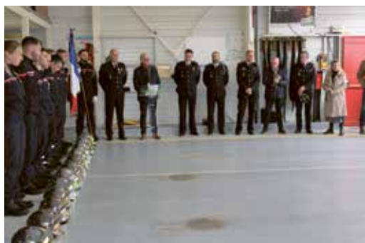
9 novembre 2024 - Sainte Barbe au Centre d'Incendie et de Secours de Château-Thébaud