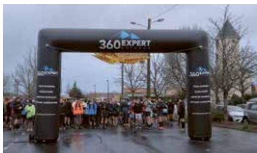
Le 7 et 8 décembre 2024 - Trail du Téléthon