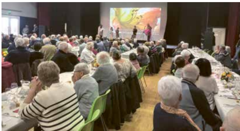
26 octobre 2024 - Repas des Aînés à l'Espace Bois Joli en présence des élus du Conseil Municipal d'Enfants