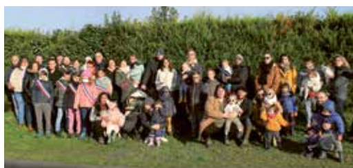
Le 11 janvier 2024 - Cérémonie « Un Arbre, Une Naissance » organisée par les élus du Conseil Municipal d'Enfants en collaboration avec la Région des Pays de la Loire