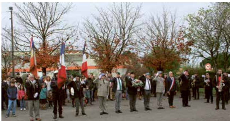
11 novembre 2024 - Commémorations du 11 Novembre à la stèle