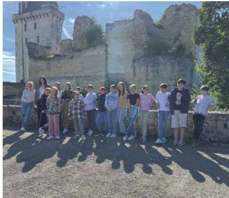
Les élus devant le château de Chinon

Le choix se porte sur un format A4 replié en format A5. Sur le recto 2 photos avec un texte en écriture manuelle et au verso une photo collective avec insertion des noms et prénoms, à l'intérieur de la carte, la lettre.