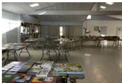
Expo vente de livres les 22 et 23 novembre

Puis, nous avons clôturé, le dernier jour d'école de l'année par notre goûter des vacances de Noël, afin de fêter dignement les vacances. Enfin, un grand merci aux bénévoles qui font vivre cette association pour le plaisir des enfants.