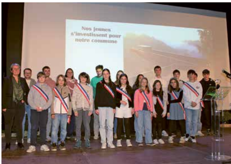
10 janvier 2025 - Cérémonie des Vœux du Maire à l'Espace Bois Joli

Directeur de la publication : Alain BLAISE Responsable de la communication : Viviane HERMON Nombre d'exemplaires : 1350 Dépôt légal : 1 er semestre 2025