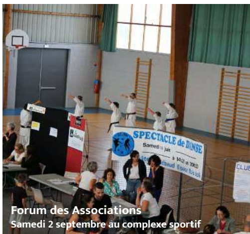
Forum des Associations Samedi 2 septembre au complexe sportif