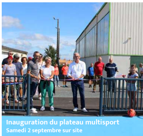
Inauguration du plateau multisport Samedi 2 septembre sur site