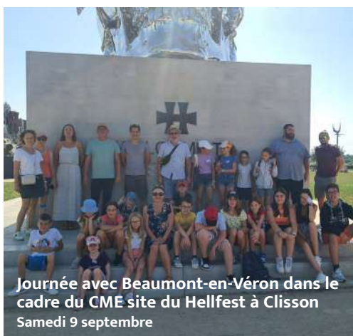
Journée avec Beaumont-en-Véron dans le cadre du CME site du Hellfest à Clisson Samedi 9 septembre