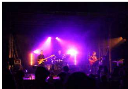
suivi de Airplane