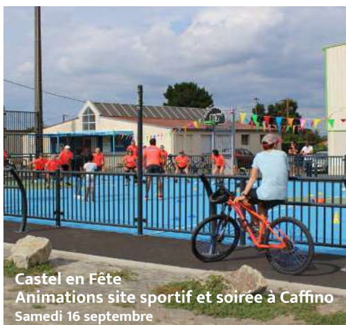
Castel en Fête Animations site sportif et soirée à Caffino Samedi 16 septembre