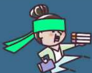
Illustration de Rémi Manguin

N'hésitez pas à nous rejoindre pour partager ces moments conviviaux avec nous. apemarcancelcanonnet@gmail.com