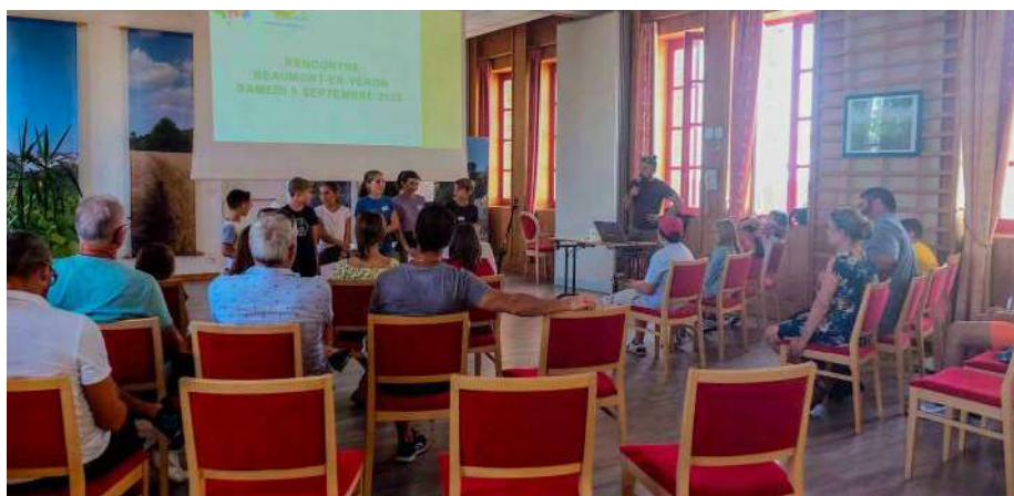
Journée avec le CME de Beaumont-en-Véron le 9 septembre 2023