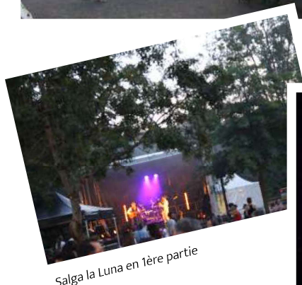
Salga la Luna en 1ère partie

Les enfants des écoles de la commune ont pu préalablement s'adonner à la traditionnelle « Balade aux lampions ».