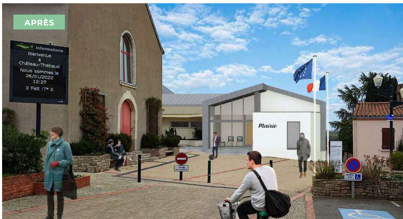
Insertion graphique du projet dans son environnement