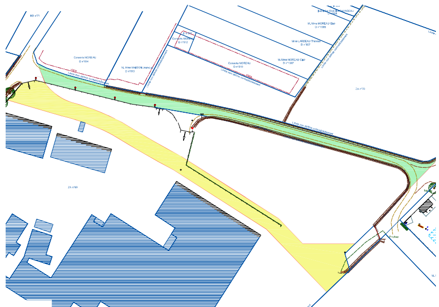
Déclassement de la voie (en vert) Classement de la nouvelle voie (en jaune)

Une enquête publique aura lieu du lundi 16 au lundi 30 octobre 2023.