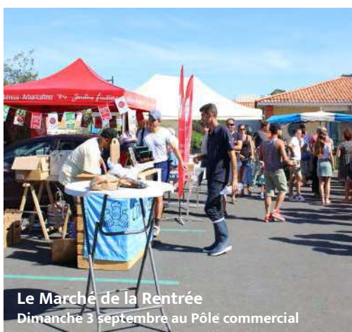
Le Marché de la Rentrée Dimanche 3 septembre au Pôle commercial